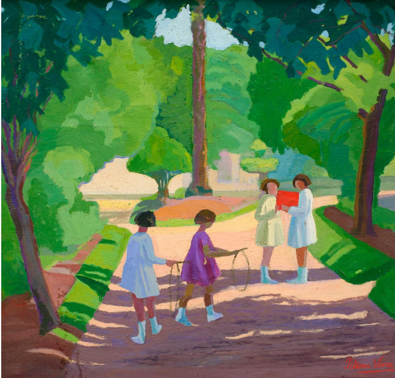
“Jugando al arco” (1924) Petrona Viera Museo Provincial de Bellas Artes B. Franklin